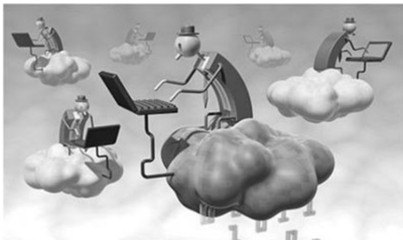
Fig. 3

desarrollado soluciones de seguridad para mitigar amenazas a las TI. Un ejemplo de ello son las tecnologías en la nube para combatir códigos maliciosos, lo cual ha revolucionado la forma en que se concebía el software antivirus, dado que en los tradicionales se almacenan sus firmas en una base de datos local y requieren de una constante actualización. En cambio los antivirus en la nube alojan esta base de datos en el servidor remoto del proveedor y permite extraer muestras de códigos sospechosos para generar una nueva firma de manera más rápida y compartirla con todos los clientes en la nube, por lo que se puede decir que esta nueva tendencia en la detección de código maliciosos es más eficiente e inteligente. Algunos productos que ofrecen esta solución son: Panda Cloud , Trend Micro HouseCall , Immunet Protect , Kaspersky Cloud AV , entre otros.