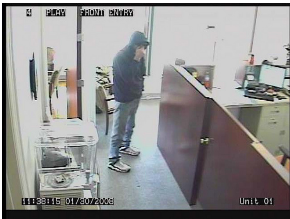
Img. 5

Ahora que conoces más sobre la ingeniería social y la seguridad de la información, la próxima vez que sientas que tu información está completamente segura, recuerda que no todas las intrusiones son siempre tan obvias como esta: