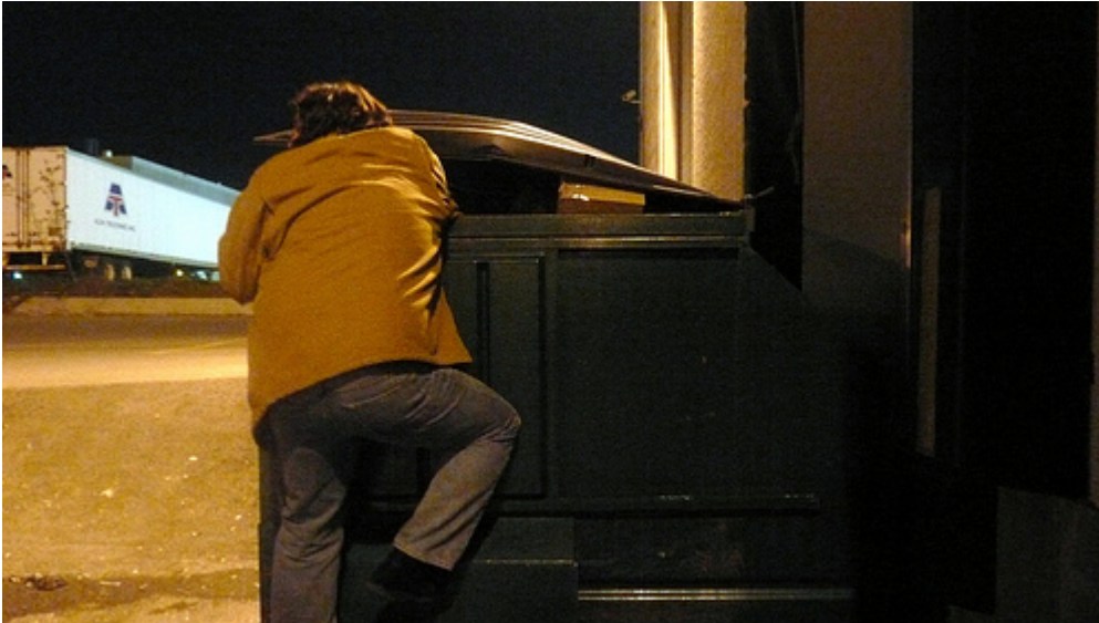
Img. 3